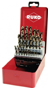
40678 Jeux de forets DIN 338 type N HSS-G Co5 (25 pièces)