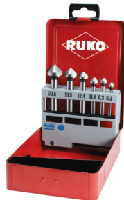
40664 Jeux de fraises à chanfreiner C 90° DIN 335 HSS