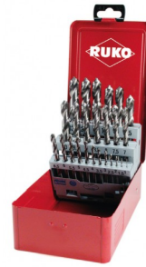
40677 Jeux de forets DIN 338 type N HSS-G (25 pièces)