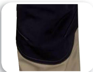
Parties renforcées anti-salissures M5COM - M5PAN - M5SAL - M5VES - M5GIL