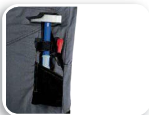
Poche mètre porte-outils M5COM - M5PAN - M5SAL