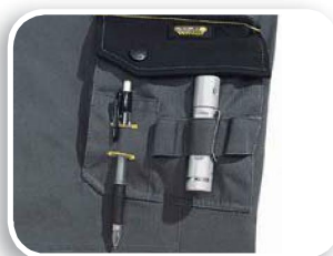
Poche porte-outils M5COM - M5PAN - M5SAL