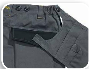
Jeu de 2 poches amovibles par boutons 2 positions sur taille M5COM - M5PAN - M5SAL

Toile 60 % coton 40 % polyester 270 g/m 2 . Empiècements : toile 55 % polyester 32 % coton 13 % élasthane 310 g/m 2 .