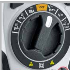
Commutateur rotatif facile à utiliser