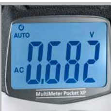
Grand écran d'affichage à cristaux liquides rétroéclairé