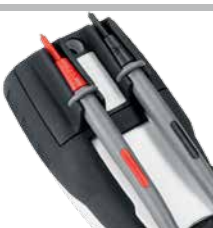
Fixation des points de mesure