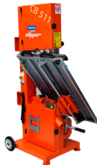
Dimensions lorsque la table est rabatue : 1050 x 900 x 1840mm