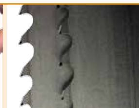
La machine est fournie avec une bande pour bloc en terre cuite