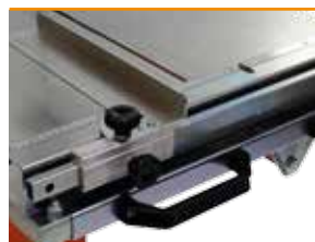
Guide de coupe