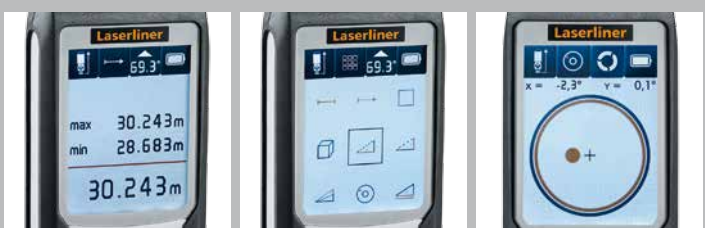
Écran d'affichage éclairé

Dimensions de l'emballage (L x H x P) 113 x 236 x 64 mm